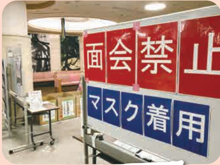
洗濯物の受け渡しを行っています。