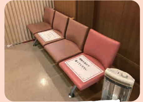
間隔を空けてお座りください。

入院患者の皆様やご家族、また、病院に勤務する職員の方の安全確保の為に、厳しく感染防止対策に取り組んでいます。