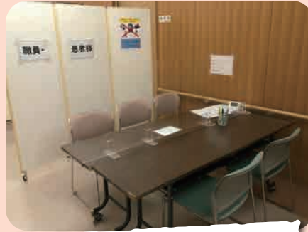
面談場所（アクリル板を使用し感染対策を行っています。）