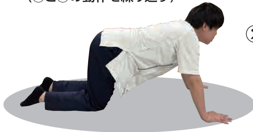
四つ這いになります。