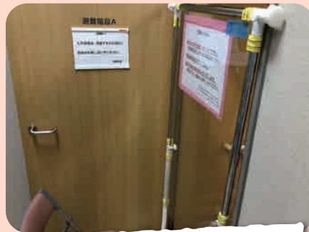
患者様や外部の方は、アクリル板を使用し面会をお願いします。