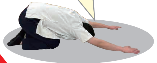
体を後ろに引いて肩を十分に伸ばし、四つ這いに戻ります。