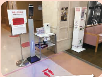
家族の方・外部の方は、検温と手指消毒をお願いします。