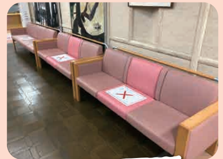
間隔を空けてお座りください。